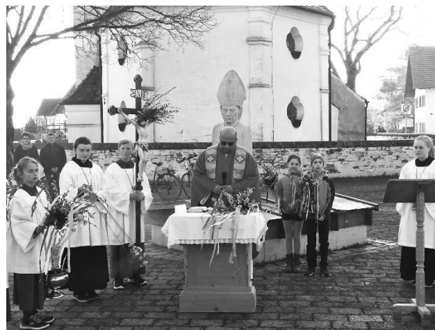
Palmweihe an der Wolfgangskirche